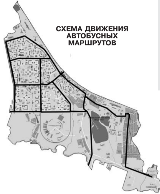
СХЕМА ДВИЖЕНИЯ АВТОБУСНЫХ МАРШРУТОВ

В 2011 году в районе будут реконструированы магистрали района: ул. Логвиненко от поликлиники № 230 до корп. 1401, ул. Каменка от пр. 657 до Панфиловского проспекта, пр. 657 от 20-го микрорайона до ул. Радио. На 10 улицах п. Малино будет реконструировано 15300 кв. м дорожного покрытия. Также будет проведена реконструкция участков подъездных дорог, прилегающих к району: Крюково - Брехово, Крюково - Жилино, Горетовка.