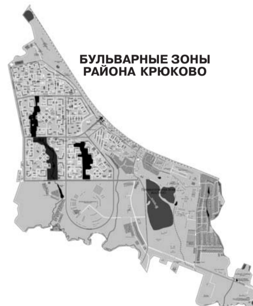
БУЛЬВАРНЫЕ ЗОНЫ РАЙОНА КРЮКОВО

В районе несколько бульварных зон с площадью свыше 1 га. Это бульварная зона “Михайловские пруды” в 15-м микрорайоне, занимающая 5,25 га, бульварная зона в 16-м микрорайоне, которая занимает 11,02 га, и бульварная зона в 20-м микрорайоне, расположенная на площади 5,56 га. Общая площадь парковых территорий округа составляет 21,83 га.