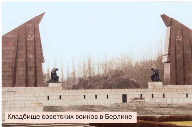
Кладбище советских воинов в Берлине